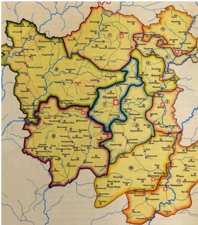
Территория Стародубского полка. 1663 – 1782 гг.

Историческая область "Стародубовье" занимает всю юго-западную часть территории Брянской области, включающую современные Стародубский, Погарский, Красногорский, Гордеевский, Злынковский, Климовский, Клинцовский, Мглинский, Новозыбковский, Почепский, Суражский и Унечский районы. Эта область на протяжении длительного времени существовала и развивалась в особых, по сравнению с северной и восточной частями