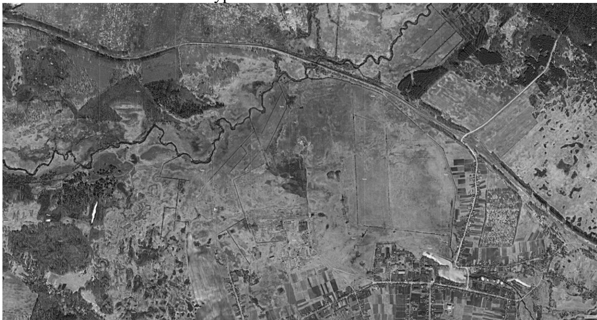
Вид территории перспективного музейно-туристического комплекса «Усадьба Гринево»